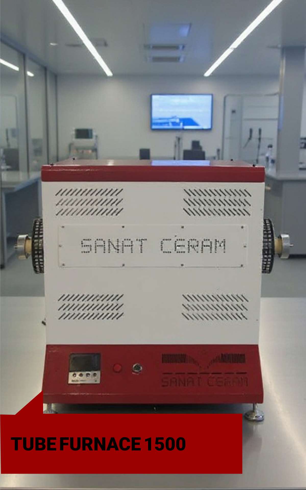
TUBE FURNACE 1500